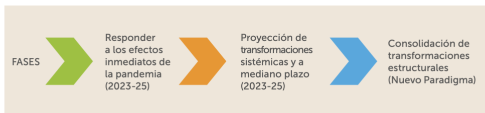
Figura 2. Pilares de la reactivación educativa